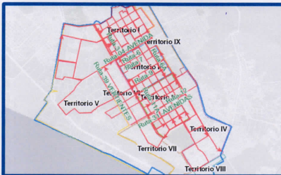
Mapa N° 02: Ruteo de los camiones compactadores