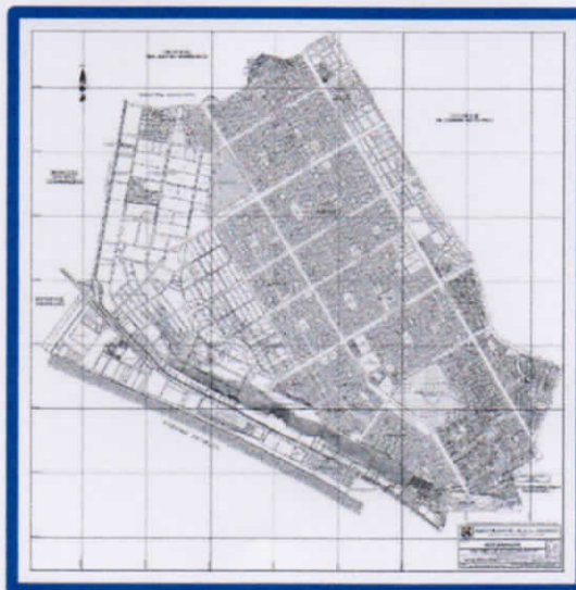
Mapa N° 01: Distrito de Villa El Salvador