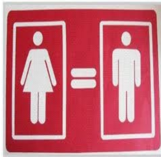
Titulo: Solo así lo logramos